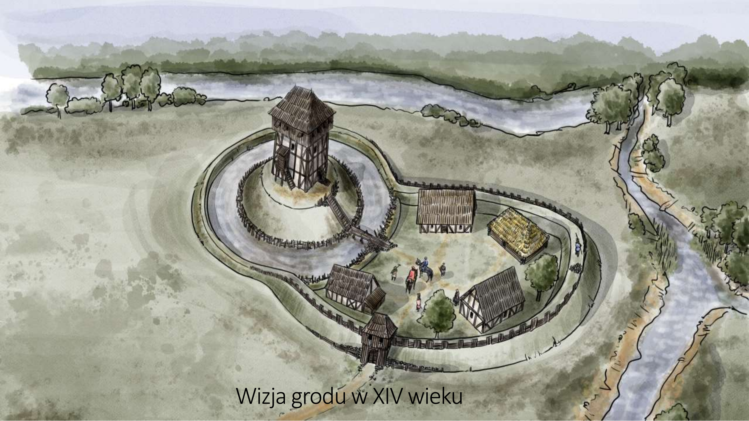
Wizja grodu w XIV wieku