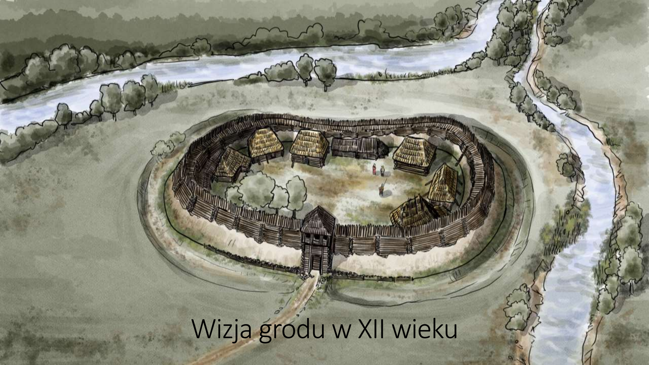
Wizja grodu w XII wieku