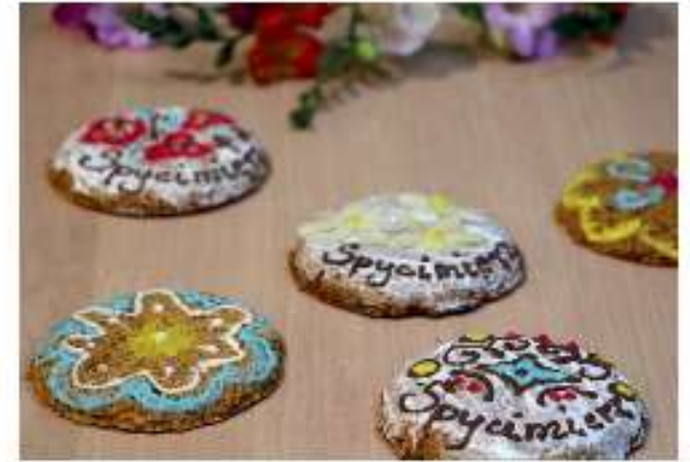
Przykłowe ciastka domowej roboty przygotowane z okazji napisu tradycji kwiatowych biskupów na światową listę UNESCO w 2021 r. / Homemade cakes prepared to celebrate the entry of the flower carpet tradition on the UNESCO World List in 2021.

W najdawniejszych czasach mieszkańcy ziemi spycimierskiej zajmowali się uprawą ziemi i hodowlą zwierząt. Żyzne gleby i bujne pastwiska położone w dolinie środkowej Warty sprzyjały produkcji żywności. Z kolei lasy obfitowały w zwierzynę i grzyby, a wody w ryby. Także dzisiaj część mieszkańców wsi położonych w parafii Spycimierz prowadzi gospodarstwa rolne. Większość zaś posiada przydomowe ogrody i sady. Spycimierz i okolice znane są z doskonałych miodów. Pszczółom świetnie się tu żyje dzięki bogatym w pokarm łąkom i ogrodom. Oprócz różnych gatunków miodów pszczelarze wytwarzają z wosku pszczelego piękne świece. Tutejsze gospodynie znane są z wybornych przepisów na naturalne dżemy, soki i przetwory warzywne. W Spycimierzu i Człopach aktywnie działają koła gospodyń wiejskich. Organizują wiele przedsięwzięć służących pielęgnowaniu ludowych zwyczajów, podczas których prezentują swoje umiejętności artystyczne i kulinarne. Każda z gospodyń posiada swój niepowtarzalny temperament, doświadczenie i pasję. Jedna świetnie piecze ciasta,